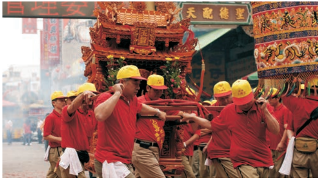
Sänfte mit daoistischer Gottheit auf Reisen