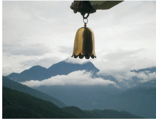
Kulisse des Zentralen Berglands am Sonne-Mond-See

dieser Folder wurde CO 2 -neutral hergestellt