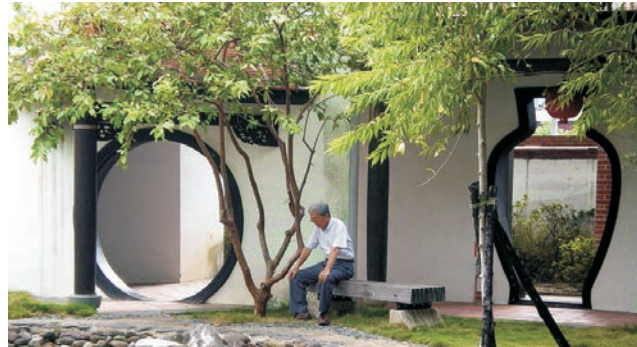
Lin An Tai: Garten-Architektur der Qing-Dynastie aus dem 18. Jh. in Taipei

Sauber wie Japan, locker wie Thailand - nach seiner enormen wirtschaftlichen Entwicklung, gehört Taiwan heute zu den Ländern mit dem höchsten Wohlstand. Der hohe Lebensstandard spiegelt sich in allen Bereichen wider: angefangen bei der hervorragenden Infrastruktur, über das Gesundheitswesen, bis hin zur vorbildlichen Bildungspolitik. Der unglaubliche Reichtum an chinesischen Kulturgütern und die teils atemberaubenden Landschaften dieser großen Insel lohnen auf jeden Fall die Anreise. Von den Portugiesen zu recht Ilha Formosa (die schöne Insel) genannt, lockt Taiwan bis heute mit einer einzigartigen subtropischen Vegetation. Der größte Teil der Insel wird durch Bergmassive mit fast 4000 m Höhe geprägt. Heiße Quellen deuten auf eine recht junge Entstehung - das Gebirge zählt zu den jüngsten weltweit. Ein