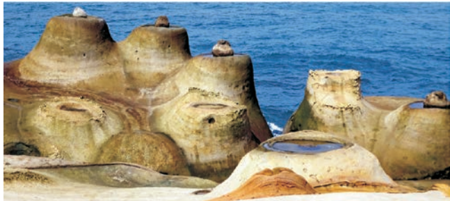
außergewöhnliche und bizarre Küstenformen im Yeliu-Geopark

Nach der Anmeldung zu dieser Exkursion wird mit der zugesandten Buchungsbestätigung eine Anzahlung (15 % des Reisepreises) fällig. Die Restzahlung erfolgt zwei Wochen vor Reisebeginn. Es gelten die Geschäftsbedingungen des Veranstalters: Geopuls GbR, Neckarhalde 62, 72108 Rottenburg (Tel. 07472-9808802). Bitte beachten Sie vor Reisebuchung unsere Allgemeinen Reisebedingungen sowie das Formblatt zur Unterrichtung des Reisenden bei einer Pauschalreise nach § 651a des BGB (EU-Richtlinie 2015/2302). Beides schicken wir vor Buchung gerne zu, oder kann auf/von der Webseite www.geopuls.de eingesehen und ausgedruckt werden.