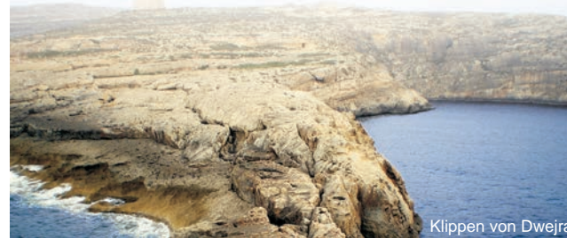
Klippen von Dwejra

GEOPULS wurde 2004 von Dozenten des Geographischen Instituts in Tübingen gegründet und veranstaltet seit 2012 gemeinsam mit dem Landesverband der Deutschen Schulgeographen NRW Exkursionen in alle Welt, mit dem Ziel kulturell und naturräumlich ganz unterschiedliche Regionen der Erde mit der ganzen Bandbreite geographischer Inhalte zu erleben. Bei allen Exkursionen werden Sie deshalb von landeskundigen Hochschulgeographen geführt, die, durch ihre Erfahrungen, zu Natur und Kultur des jeweiligen Exkursionszieles umfassende geographische Inhalte vermitteln können.