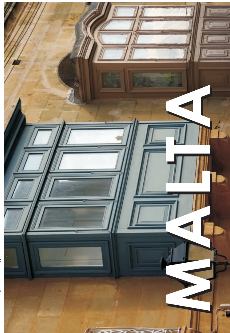
die für ganz Malta typischen Balkone sind ein Erbe aus arabischer Zeit

dem Reiseveranstalter, gegründet aus dem Geographischen Institut der Uni Tübingen