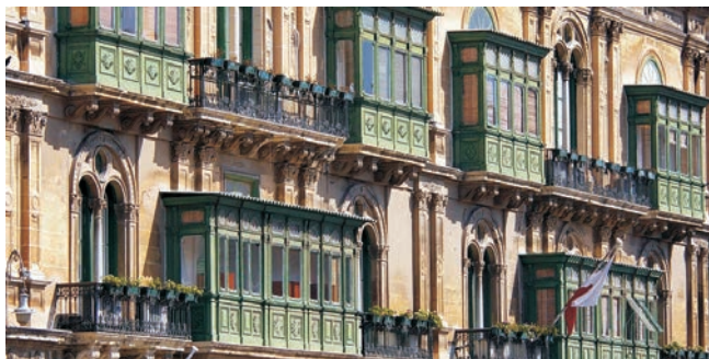
die für ganz Malta typischen Balkone sind ein Erbe aus arabischer Zeit

Nach der Anmeldung zu dieser Exkursion wird mit der zugesandten Buchungsbestätigung eine Anzahlung (15 % des Reisepreises) fällig. Die Restzahlung erfolgt zwei Wochen vor Reisebeginn. Es gelten die Geschäftsbedingungen des Veranstalters: Geopuls-Studienreisen, Neckarhalde 62, 72108 Rottenburg (Tel. 07472-9808802). Die Allgemeinen Reisebedingungen werden auf Wunsch vorab zugeschickt, oder können unter www.geopuls.de ausgedruckt werden.