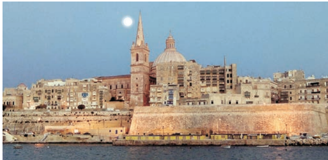
abendliche Silhouette von Valletta