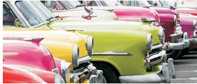
Klassiker der 1950er ...

dieser Folder wurde CO 2 -neutral hergestellt