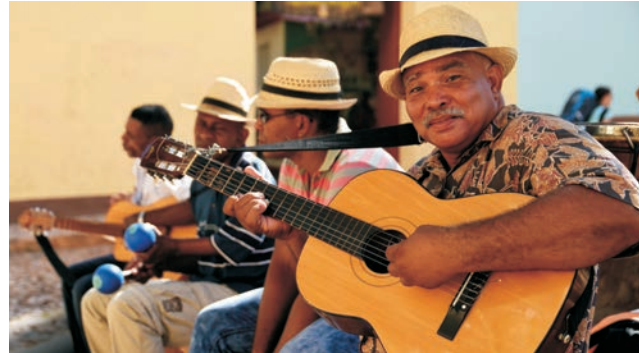
... und Musiker gehören zu Kuba ...

GEOPULS wurde 2004 von Dozenten des Geographischen Instituts in Tübingen gegründet und veranstaltet seit 2012 gemeinsam mit dem Landesverband der Deutschen Schulgeographen NRW Exkursionen in alle Welt, mit dem Ziel kulturell und naturräumlich ganz unterschiedliche Regionen der Erde mit der ganzen Bandbreite geographischer Inhalte zu erleben. Bei allen Exkursionen werden Sie deshalb von landeskundigen Hochschulgeographen geführt, die, durch ihre Erfahrungen, zu Natur und Kultur des jeweiligen Exkursionszieles umfassende geographische Inhalte vermitteln können.