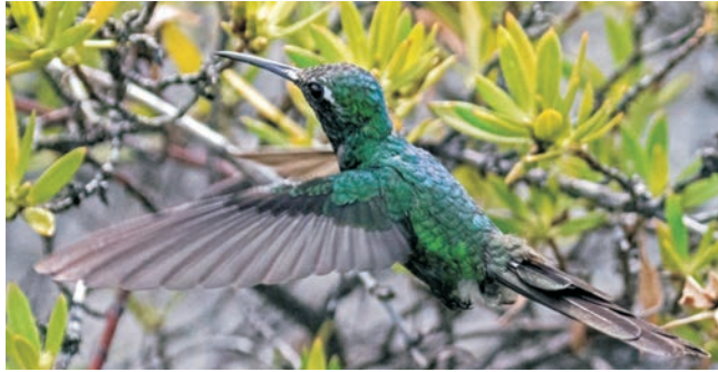
Kolibri in der Mangrove, Zapata-Halbinsel