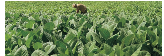
... wie der Tabak und die daraus hergestellten Zigarren