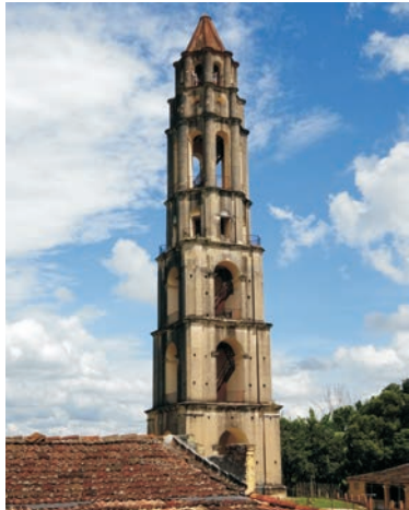
Torre de Iznaga im Tal der Zuckermühlen, bei dem es sich, wie auch beim Valle de Viñales, geomorphologisch nicht um ein Tal handelt